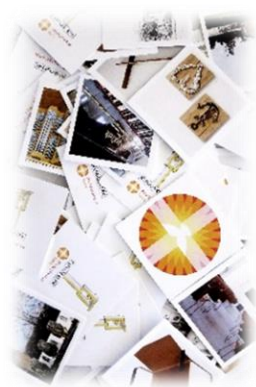
Enkele kaartjes Memoryspel